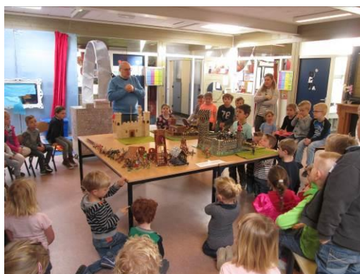
Ouder vertelt tijdens project Middeleeuwen over de verschillende soorten kastelen.

De MR van Rennevoirt overlegt ook met MR's van de andere scholen van Tangent. Dit gebeurt in de Gezamenlijke Medezeggenschapsraad.