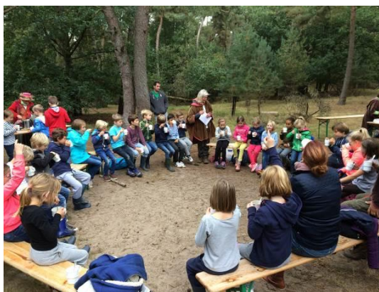
Het bewaarde land

Het doel van ons toelatingsbeleid is ouders/verzorgers zoveel mogelijk duidelijkheid te geven, wanneer hun kind wel of niet wordt toegelaten tot de Tangentschool van hun keuze. Het volledige beleid van Tangent is te vinden op www.tangent.nl en op de website van de school.