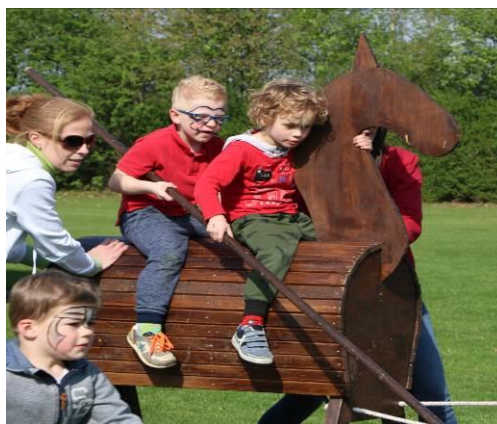
Afsluiting project Middeleeuwen met Ridderspelen dag