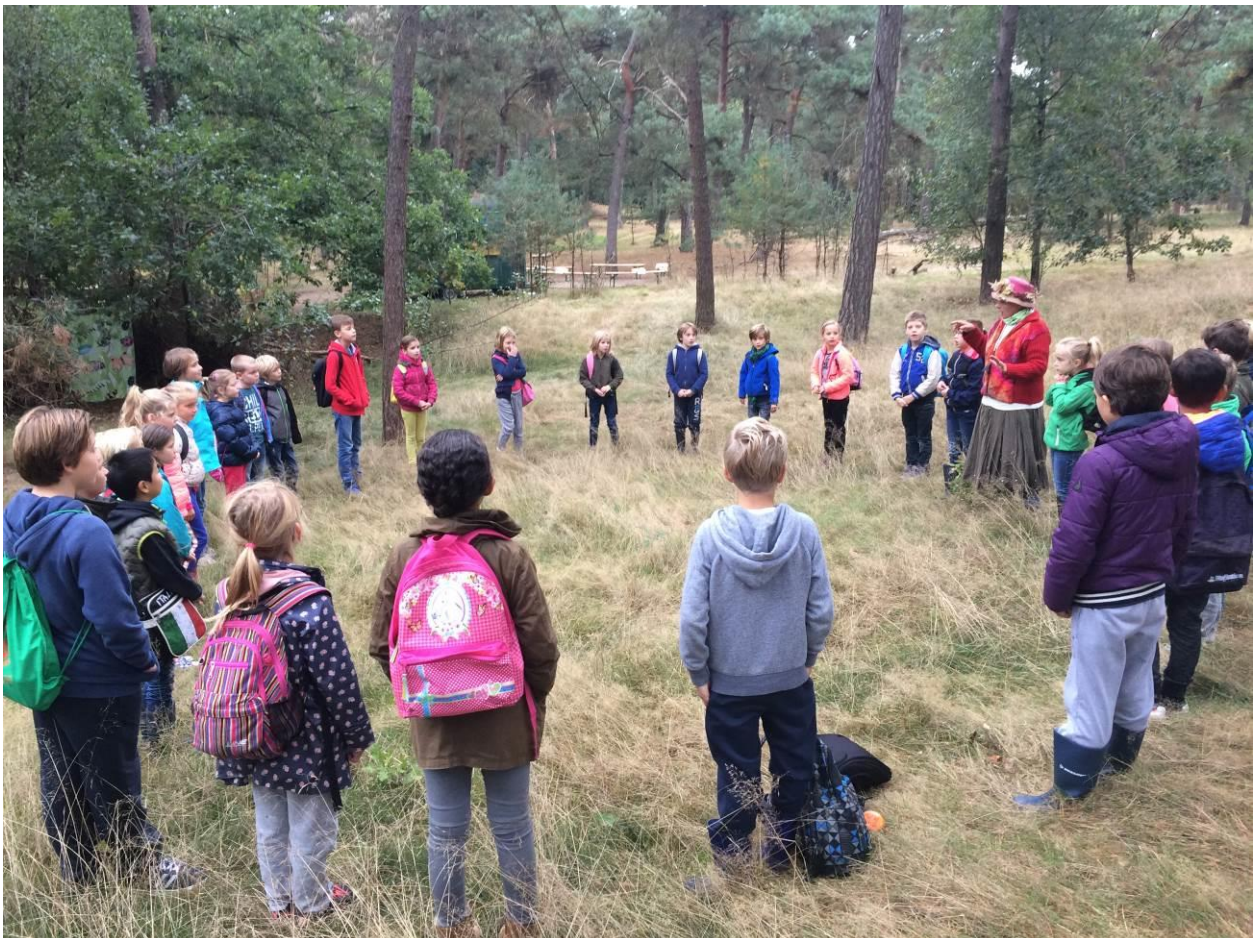
Het bewaarde land